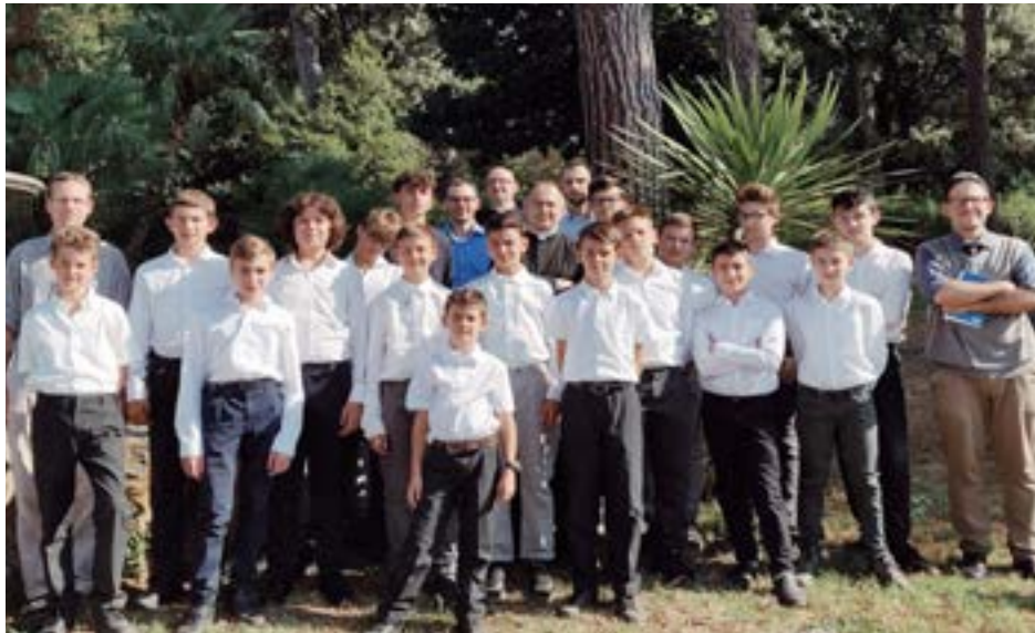
Correva l'anno scolastico 2020/2021