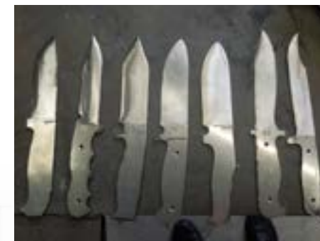
Coltelli in preparazione

Giochi, vacanze, sport, vittorie contro altri giovani... credo, cari lettori, di aver proprio esaurito tutti gli argomenti degni di cronaca e per questo motivo, nonostante un certo rammarico, sono costretto a lasciarvi. Tuttavia convinto che nella vostra mente ci saranno altri interrogativi concernenti le attività che si svolgeranno dopo il primo maggio e di cui racconteremo nel prossimo imperdibile numero.