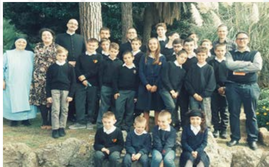
Correva l'anno scolastico 2018/2019