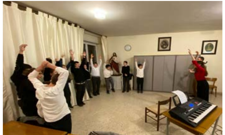
Correva l'anno scolastico 2019/2020