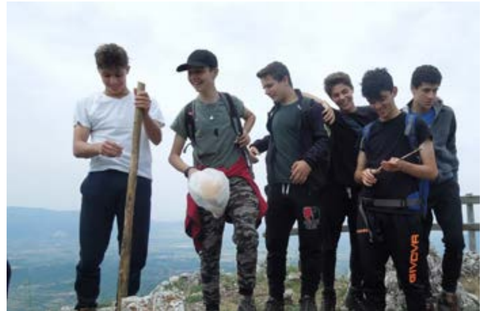
Correva l'anno scolastico 2021/2022